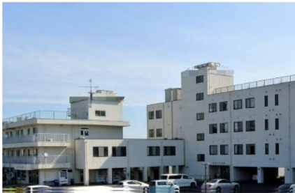
リハビリセンター改修@茂原市