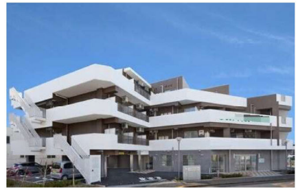
老人福祉施設@西東京市